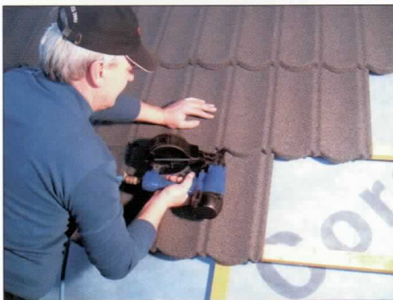
Montáž panelů pneumatickým kladivem, přičemž panely jsou uloženy střídavě s polovičním přesahem.

Toto řešení montáže montážním hřebíkem je výhodnější než ukotvení jiných veľkoplošných krytin prostřednictvím šroubků přes vrchní plochu krytiny, především z hlediska dlouhodobé nepropustnosti vody. V případě krytin Metrotile nedochází k narušení celistvosti krytiny na ploše, po které stéká voda , ale na vertikální, kde se voda téměř nedostane.