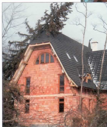
Kvalitu montážního systému prověřila i extrémní vichřice.